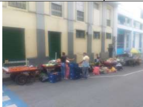
Calle 18 entre carreras 10 y 11