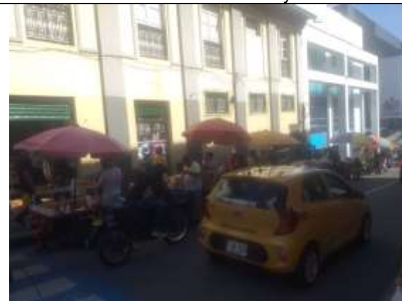
Calle 18 entre carreras 10 y 11