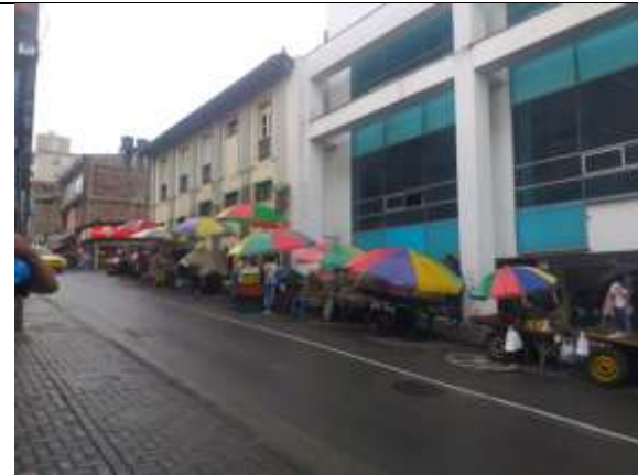
Calle 18 entre carreras 10 y 11